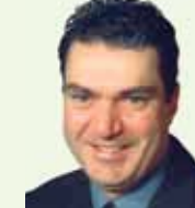
Guy Crépeau Semences Crépeau inc.